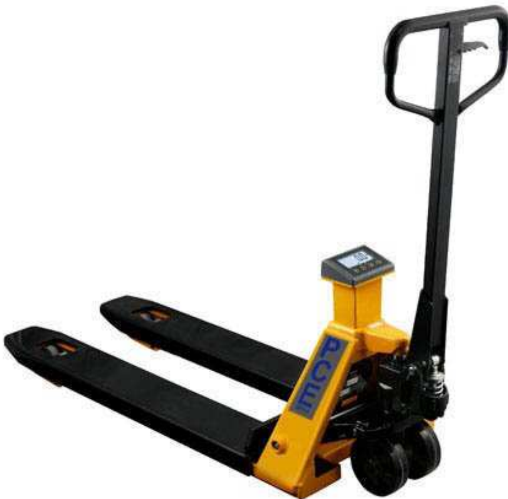
Transpallet pesatore con bilancia PCE-PTS 1

Il transpallet pesatore PCE-PTS 1 è una bilancia mobile con un range di misura da 2000 kg. Può utilizzare il transpallet pesatore in qualsiasi luogo della sua azienda. Può trasportare e pesare la sua merce durante l'operazione di carico direttamente nella piattaforma da carico. Questo significa: tempi di carico e scarico inferiori e tragitti più brevi con i pallet pieni. Con questo transpallet pesatore non ha più bisogno di portare i suoi pallet alla pesa e depositarli lì per conoscerne il peso; tutto il contrario, adesso può leggere il peso direttamente nell'ampio display del transpallet pesatore. Potrà fare pesate senza complicazioni e con un controllo ottimale. Grazie all'alimentazione a batteria, può usare il transpallet pesatore in qualsiasi punto della sua azienda. Grazie alle ruote in Vulkollan può muovere il transpallet pesatore anche su un suolo irregolare. Per ulteriori informazioni sul transpallet pesatore PCE-PTS 1 si metta in contatto con noi al numero +39 0583 975114 o utilizzi il nostro servizio di contatto . I nostri tecnici e ingegneri la sapranno consigliare su questi transpallet pesatori e sugli altri nostri prodotti: sistemi di regolazione e controllo , misuratori , strumenti per laboratorio o bilance di PCE Instruments .