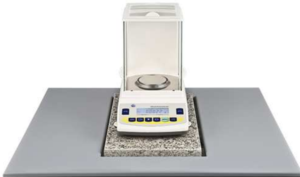
Tavolo antivibrazioni PCE-AVT 1 con bilancia di analisi della serie PCE-AB