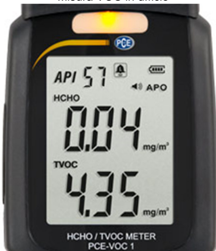
Display del misuratore PCE-VOC 1