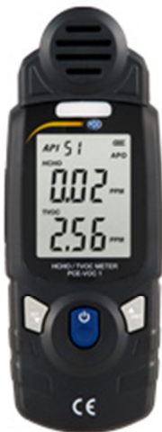
Vista frontale del misuratore VOC