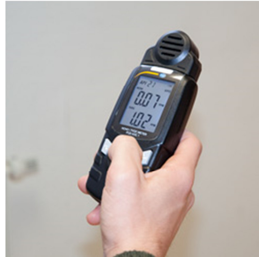
Utilizzo del misuratore VOC