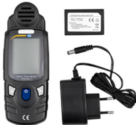
Contenuto della spedizione del misuratore PCE-VOC 1