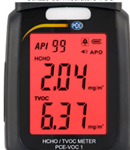
Il misuratore PCE-VOC 1 in modalità di allarme