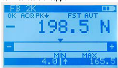
Misuratore di coppia: informazioni sullo stato della batteria, la frequenza di campionamento, la forza, i valori MAX / MIN.