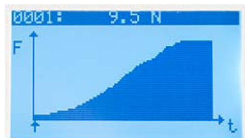
Misuratore di coppia: Analisi grafica dello sviluppo della torsione. È possibile consultare singoli valori.