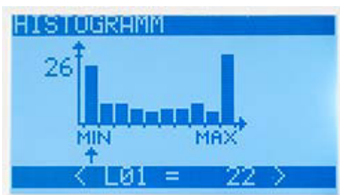
Presentazione della distribuzione della frequenza del misuratore di coppia della serie PCE-FB TS