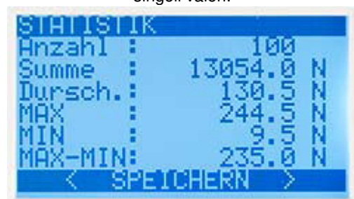
Statistiche del misuratore di coppia della serie PCE-FB TS