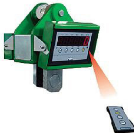
Dimensioni della bilancia a gancio industriale