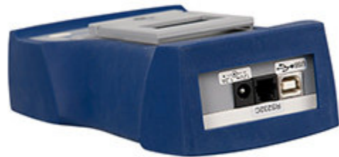
Connessione del dinamometro della serie PCE-FB per trazione e compressione