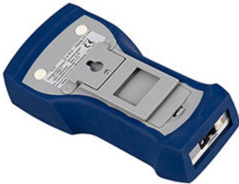
Parte posteriore del dinamometro della serie PCE-FB con cella di carico interna. Si può vedere il vano batterie e il sistema di fissaggio a 4 viti