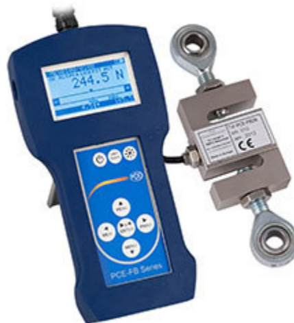
Dinamometro della serie PCE-FB K con cella di carico esterna