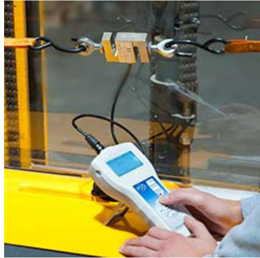
Dinamometro della serie PCE-FB con cella di carico esterna per forze di trazione e compressione