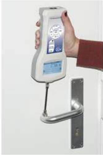
Dinamometro della serie PCE-FB con cella di carico interna per forze di trazione e compressione

Il dinamometro PCE-FB per misure di trazione e compressione si consegna con il software. Le misure effettuate con il dinamometro si possono visualizzare e controllare usando questo software. La prova effettuata visualizza la misura delle forze di trazione e compressione entro i limiti stabiliti. Nella parte inferiore può trovare l'analisi statistica delle misure precedenti con il valore minimo, massimo, medio ecc., così come le configurazioni del dinamometro serie PCE-FB.