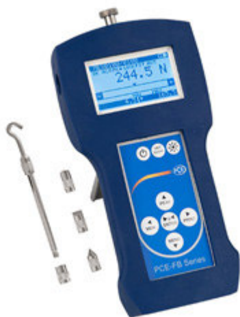
Dinamometro della serie PCE-FB con cella di carico interna