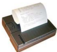
Stampante PCE-BP1 opzionale