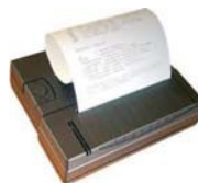
Stampante PCE-BP1 opzionale