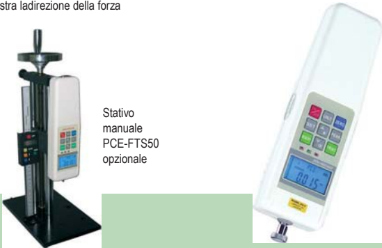
Stativo manuale PCE-FTS50 opzionale