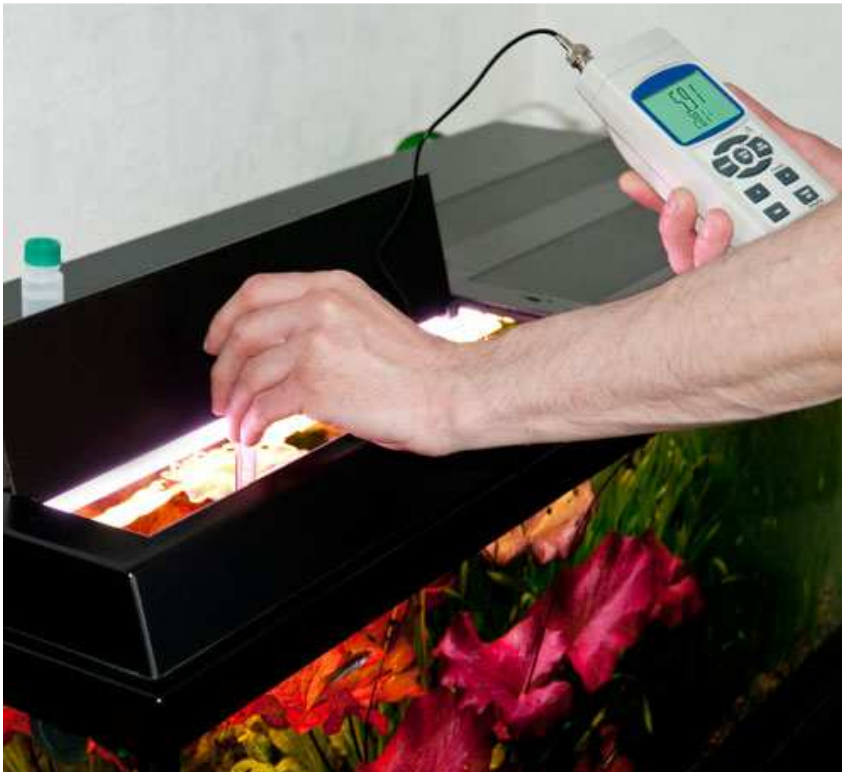
Immagine dell'uso del PCE-228