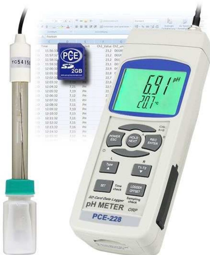
pH-metro PCE-228 con elettrodo di pH-PE-03

Questo pH-metro PCE-228 è molto facile da usare per misurare pH / mV / °C. Il valore del pH e della temperatura possono essere memorizzati direttamente nella memory card SD, oppure, attraverso l'interfaccia RS-232 possono essere inviati ad un PC. Per questo le offriamo il software ed il cavo dati RS-232 come accessori opzionali. La compensazione della temperatura viene effettuata manualmente o automaticamente per mezzo di un sensore di temperatura incluso nella spedizione. Tutto ciò fornisce una misura del pH di grande affidabilità. Il pH-metro ha una calibratura su 3 punti che può essere effettuata automaticamente. Con il pH-metro combinato si possono determinare il valore di pH, la temperatura o il potenziale REDOX (ORP). Per questo ultimo parametro di misura dovrà richiedere un elettrodo REDOX supplementare. Le raccomandiamo l'elettrodo ORP 14. Il pH-metro è alimentato a batterie (inclide). Per ulteriori informazioni sul pH-metro PCE-228 si metta in contatto con noi al numero +39 0583 975114 o utilizzi il nostro servizio di contatto . I nostri tecnici e ingegneri la sapranno consigliare su questi pH-metri e sugli altri nostri prodotti: sistemi di regolazione e controllo , misuratori , strumenti per laboratorio o bilance di PCE Instruments .