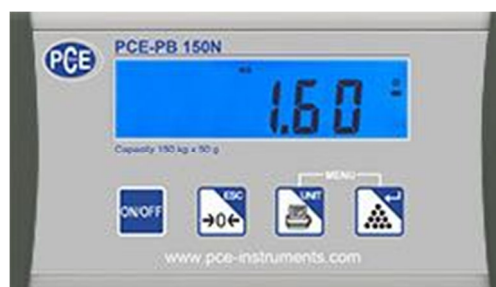
Display della bilancia per casa della serie PCE-PB N