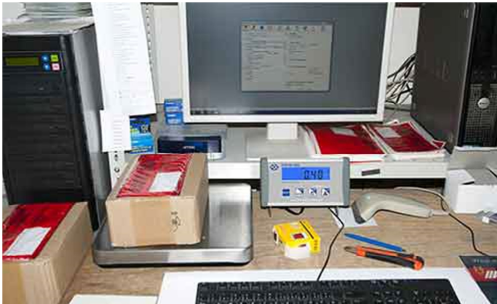
Bilancia industriale della serie PCE-PB N in combinazione con DHL