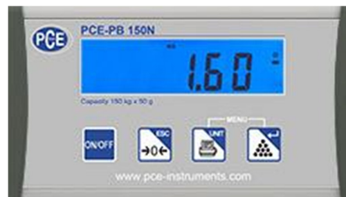
Display della bilancia industriale della serie PCE-PB N